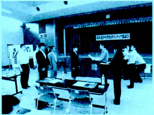
委嘱状交付の様様

6月9日、岐阜市北部コミュニティセンターにおいて、岐阜北少年警察ボランティア協議会の総会が行われました。岐阜北警察署長から少年補導員等に委嘱状が交付され、地域に密着した補導活動による少年の健全な育成や安全で安心な街づくりのためのボランティア活動をお願いしました。少年警察ボランティアとは、少年非行を防止し、健全育成を図るため、街頭補導活動など非行防止活動をしていただく警察本部長委嘱のボランティアで、岐阜北地区では、50名が委嘱されています。